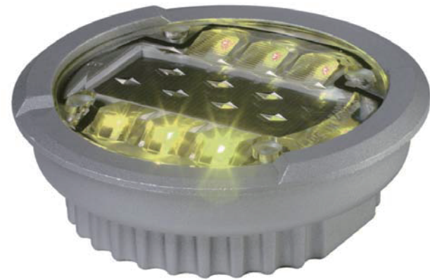
• 황색 /MS-127DSY2